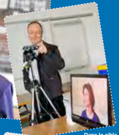
Dans la cible