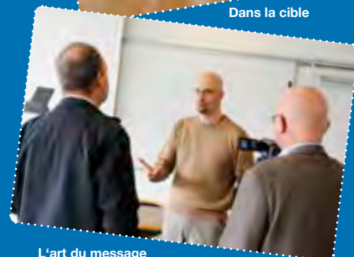
L'art du message